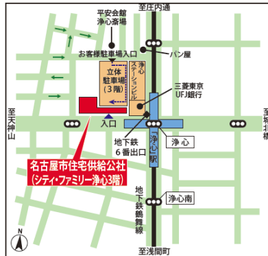
名古屋市住宅供給公社（浄心）